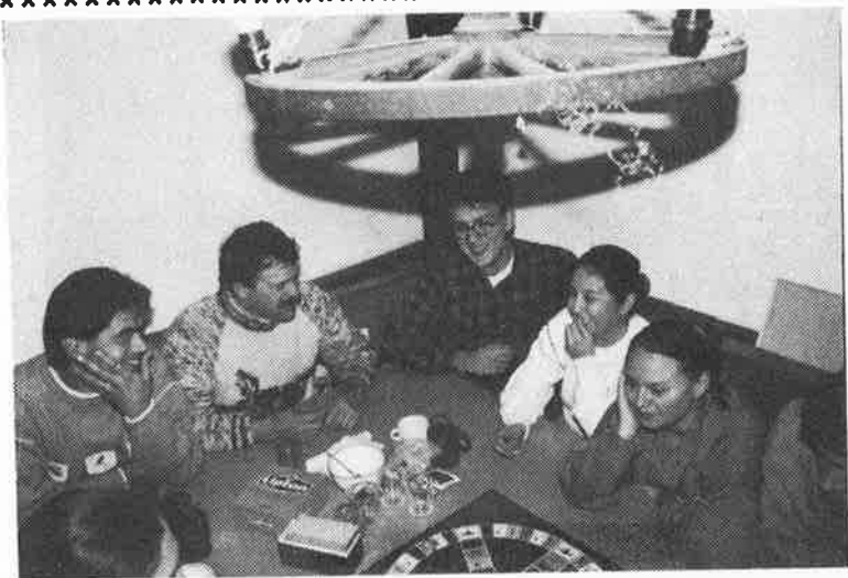
¿ Quién fué el gracioso que se robó el dado ?