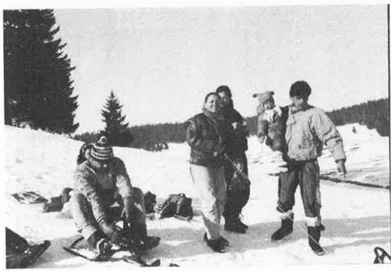
! Ahora me tiro y que me sigan los valienteeeeeee....!